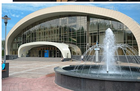
Легкоатлетический манеж «Гармония»

Томск, ул. Высоцкого, 7, стр. 6 (Автобусная остановка с/к «Кедр»)